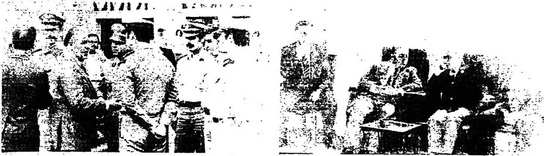
السيد والخلف محطتين بين سراحاطه عند الوزير ابو حيدر وابراهيم المحمود رئيس قسم الحماقة